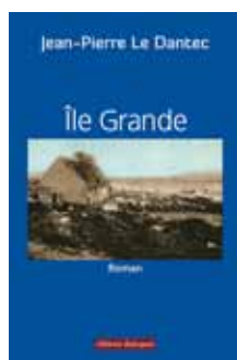
À PARAÎTRE Jean-Pierre Le Dantec Île Grande