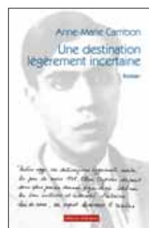
A.-M. Cambon Une destination légèrement incertaine « Une réussite » Livres Hebdo — « Convaincant » Nouvel Obs