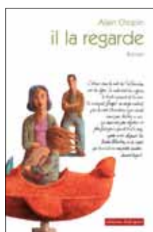
Alain Chopin Il la regarde Par l'auteur de Flaubert est un blaireau