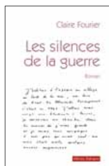
Claire Fourier Les silences de la guerre Le pendant féminin au Silence de la mer de Vercors.